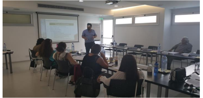
Actividades piloto de prueba del CS. TOUR con aprendices en Grecia y Chipre