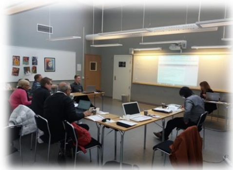
Upsala, Suecia, 23-24.10.2017

Los socios del CS. TOUR se reúnen regularmente para evaluar el progreso del proyecto, la aprobación de los productos y la planificación de los siguientes pasos. La quinta reunión del proyecto tuvo lugar en Upsala, Suecia, el 23 y 24 de octubre de 2017. FOLKUNIVERSITET fue la organización anfitriona. La reunión final del CS. TOUR está prevista para el 18 y 19 de abril de 2018 en Larisa, Grecia y será organizada por la coordinadora del proyecto, DIMITRA.