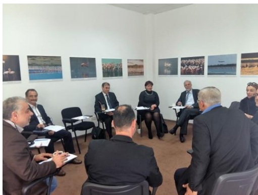
fokusgrupp, CY

Det första som CS.Tours partners behövde göra var att ta reda på om det faktiskt fanns behov av denna typ av utbildning i Social kompetens och Kulturell medvetenhet och uttrycksformer (ERF/NK 6 & 8). Behovsanalysen för utbildning för varje partner gjordes i varje respektive partnerland och på nationell nivå. Forskningen ägde rum i form av skrivbordsbaserad forskning; intervjuer med hjälp av formulär och fokusgrupper . Efter slutförandet av analysen granskade man och analyserade en sista översikt av den data och information som samlats in.